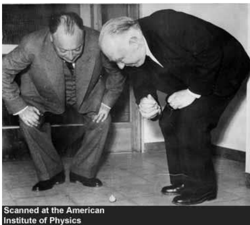
Figura 23.2: Wolfgang Pauli e Niels Bohr observam um “Tippe Top”. Foto tirada em 31 de Maio de 1951, durante a inauguração de um novo instituto de Física na Universidade de Lund, Suécia. Um “Tippe Top” é um tipo especial de pião simétrico que tem a curiosa propriedade de inverter seu eixo de rotação, erguendo com isso seu centro de massa, ao perder energia. O “Tippe Top” foi patenteado em 1891 por Helene Sperl, sob o nome de “Wendekreisel”. O “Tippe Top” é até os dias de hoje objeto de estudo. Para um artigo de revisão, vide